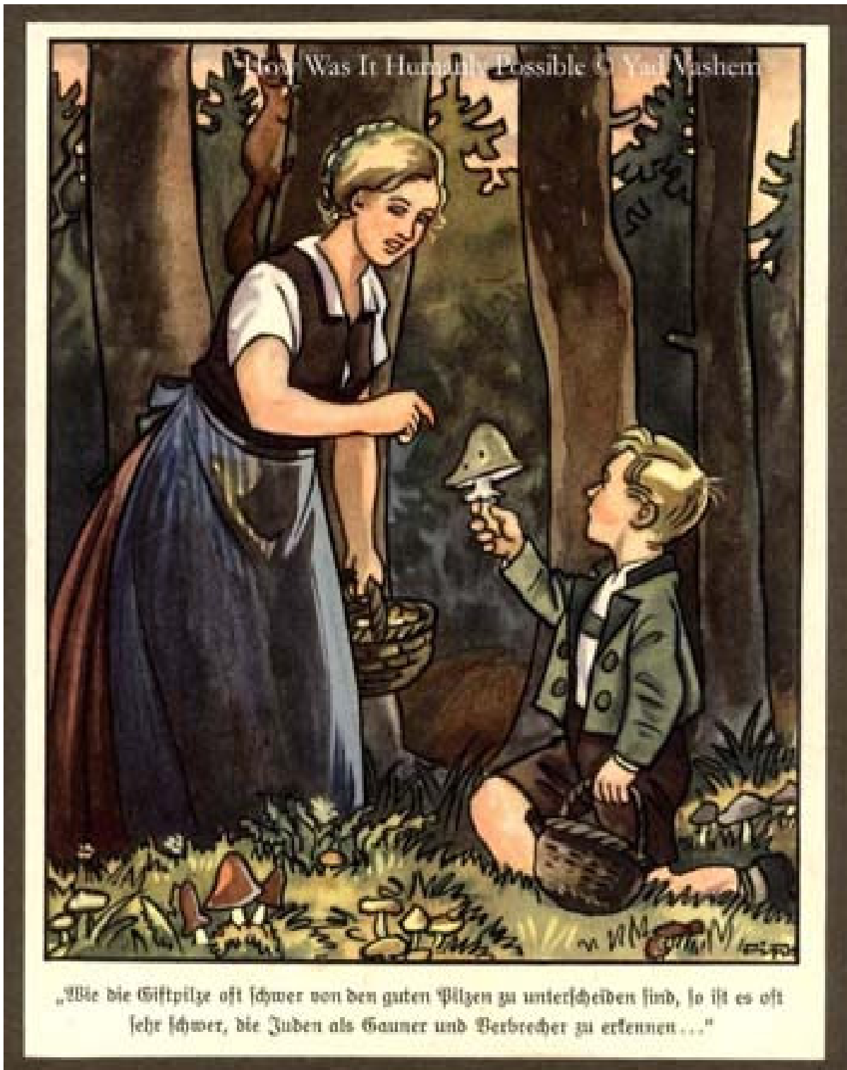
Beispiel für propagandistische Indoktrinierung