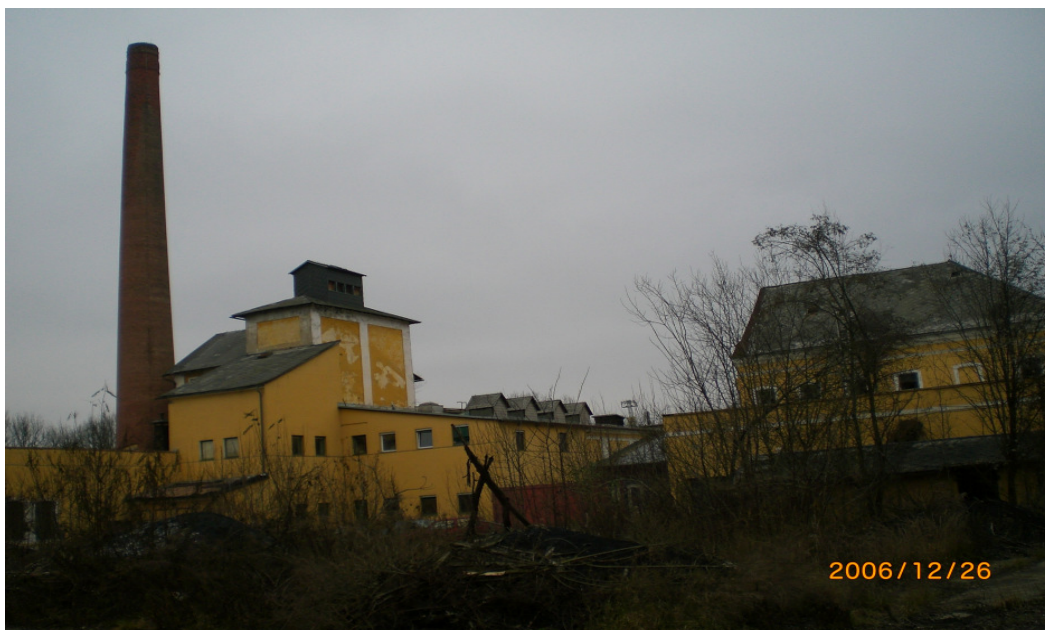
Gelände der ehemaligen Fabrik Fischl

Bisher einzige uns bekannte umfangreiche Publikation über jüdisches Leben in Kärnten sowie das Schicksal der Kärntner Jüdinnen und Juden. Enthält sowohl Informationen über das Leben jüdischer KärntnerInnen vor dem Nationalsozialismus sowie eine Darstellung ihrer Verfolgung und der Zerstörung jüdischen Lebens in Kärnten.