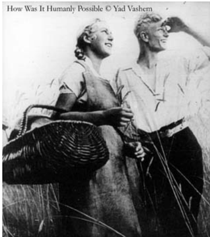
„Arisches Ideal“: Nationalsozialistische Bildklischee über Angehörige der „Volksgemeinschaft“