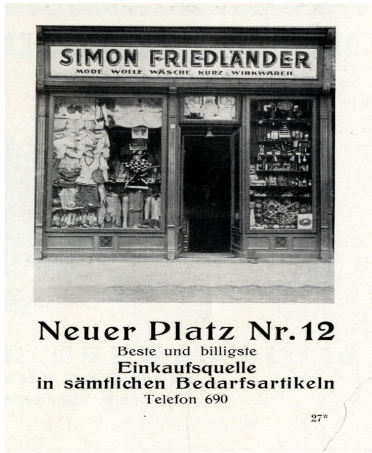
Werbeannonce des jüdischen Kaufladens Friedländer