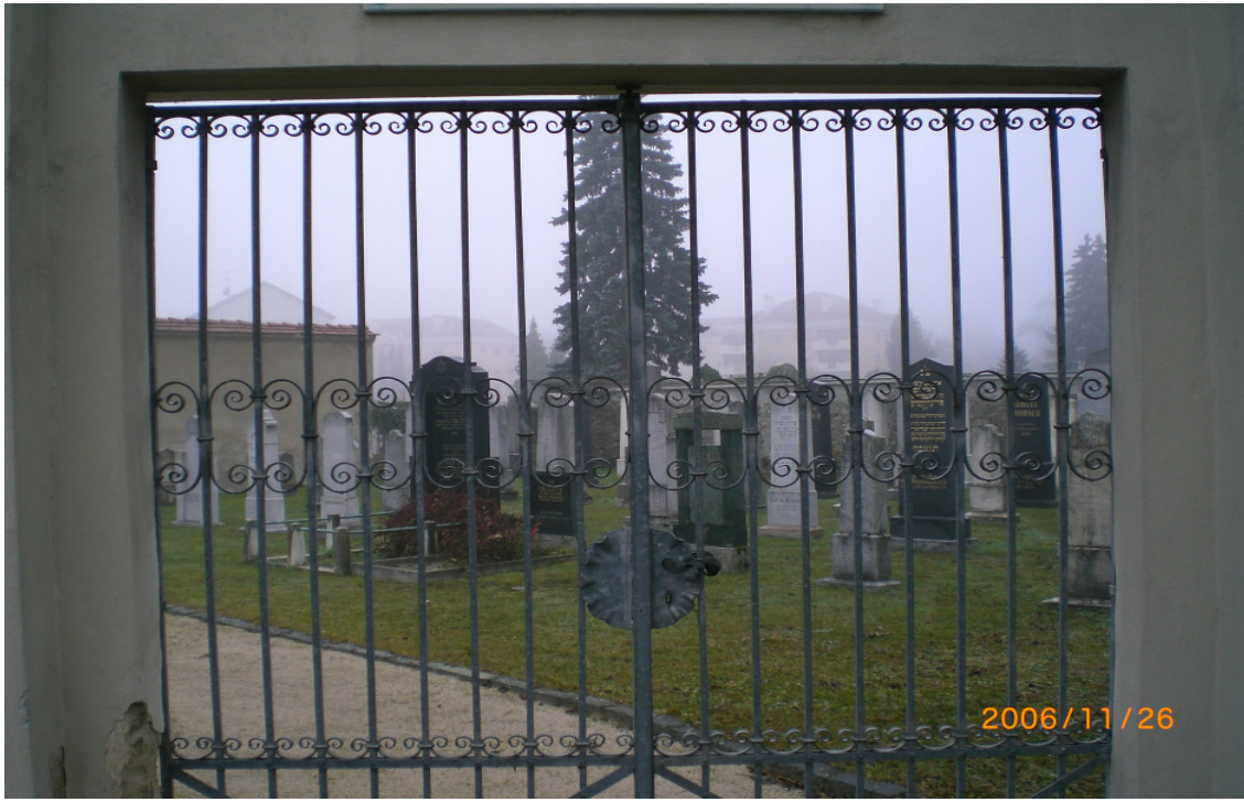
Jüdischer Friedhof Klagenfurt im Dezember 2006