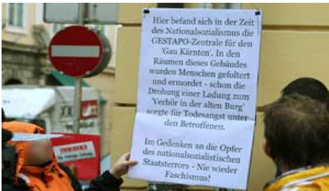
Provisorische Erinnerungstafel am Gebäude der ehemaligen Gestapo-Zentrale, September 2006

Sein Leichnam wurde zunächst im Friedhof Annabichl in Feld XVI, Reihe 14, Grabnummer 2 beigesetzt. Mitte der 70er Jahre wurden die Gebeine des oberösterreichischen Partisanen exhumiert und zusammen vierzehn weiteren am Kreuzbergl erschossenen Opfern der Deutschen Wehrmacht nach St. Veit a.d. Glan in den dort neu geschaffenen „Soldatenfriedhof“ überführt, wo er nun mit einigen Dutzend weiteren Opfern der nationalsozialistischen Verfolgung als „gefallener Soldat“ ruht. 65